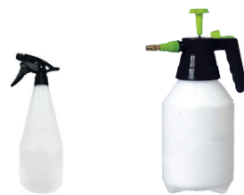
PULVERIZADORES DE 2 Y 5 LITROS

Intervención inmediata en incendios localizados y contenidos