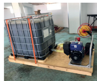
EQUIPO AUTÓNOMO DE EXTINCIÓN

Intervención en grandes incendios Necesita colocar una motobomba al depósito.