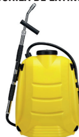
MOCHILA DE EXTINCIÓN

Intervención inmediata en incendios medianos Permite la aproximación al fuego y construir una barrera protectora.